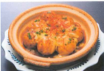
たこ焼きイタリアン