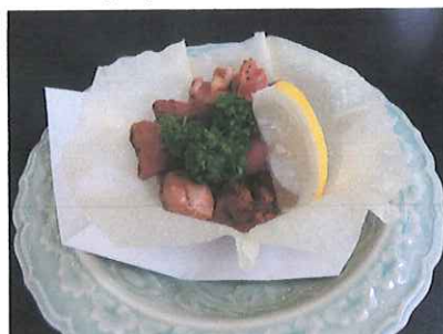
ひとくち砂肝塩焼き

茄子田楽 六九〇円 揚げ出し豆腐 六七〇円 鳥軟骨唐揚げ 七二〇円 ひとくち砂肝塩焼き 九二〇円 香味フライドポテト 六七〇円