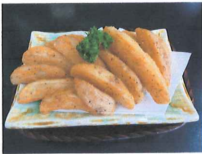
香味フライドポテト