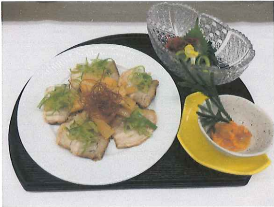
ほや塩辛・生くらげ酢 チャーシューメンマ盛り