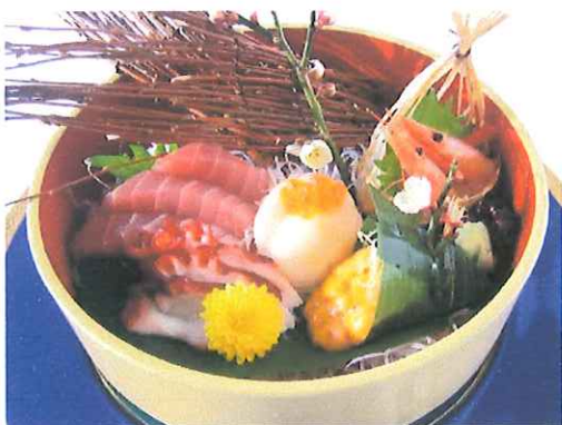
お造り盛り合せ ご希望により承ります。