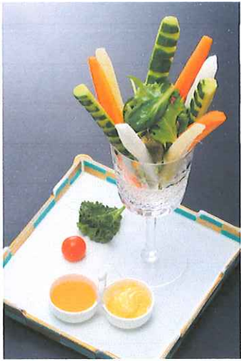
スティックサラダ